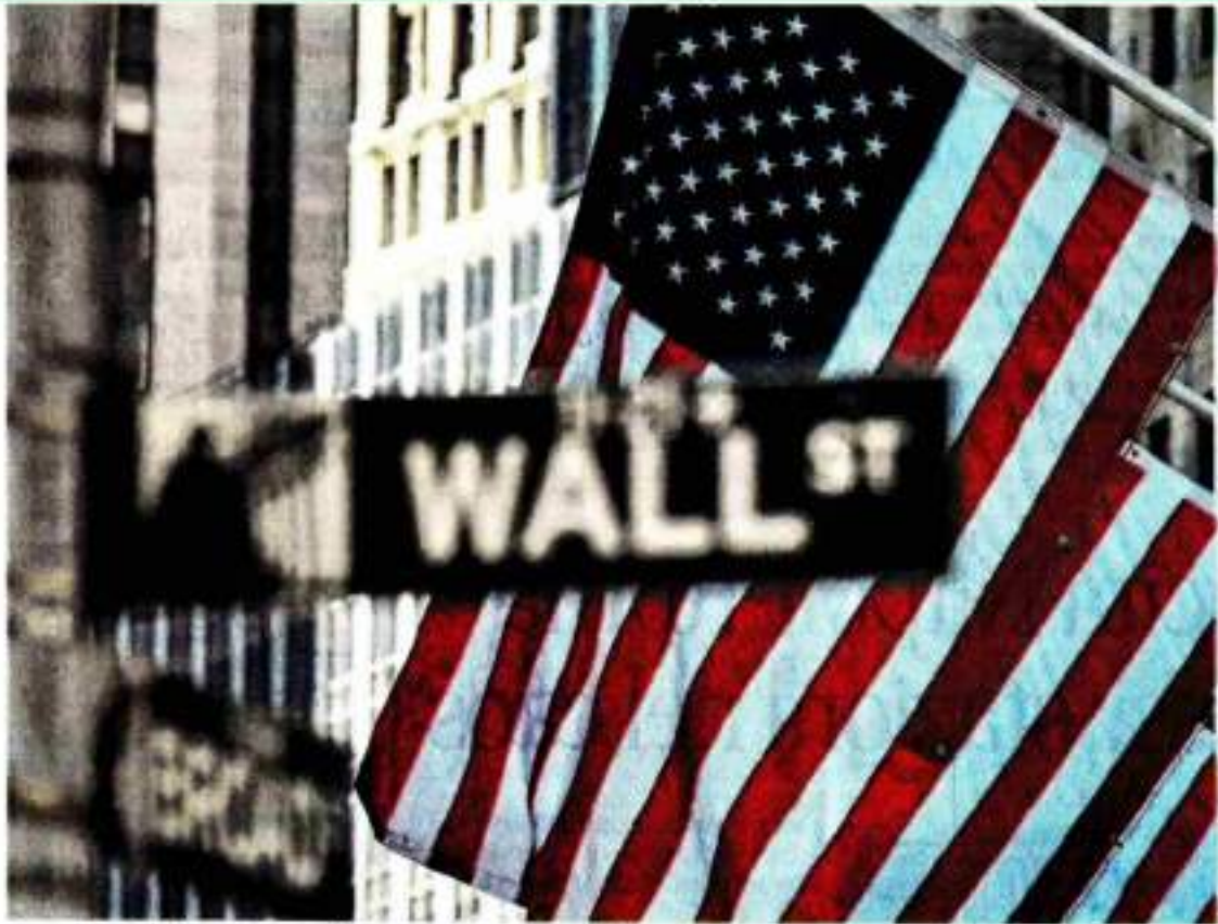
La sede della borsa statunitense a Wall Street, a New York