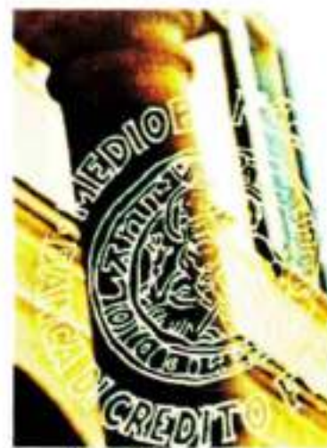
La sede di Mediobanca