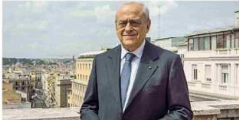
Imprenditore Francesco Gaetano Caltagirone, presidente di Caltagirone spa

● È il quinto uomo più ricco d'Italia con un patrimonio di 12 miliardi, ma anche uno dei più influenti nelle partite cruciali della finanza del Paese