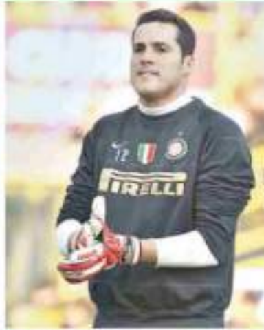
● L'ex portiere brasiliano Julio Cesar oggi ha 46 anni. Tra il 2005 e il 2012 ha difeso la porta dell'Inter