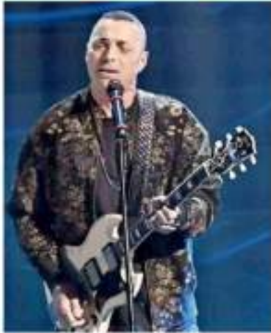
● Il cantante Alex Britti, 57 anni, era già stato spiato come emerso dall'indagine sull'azienda Equalize