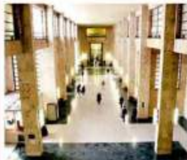
Il tribunale di Milano

La relazione arrivata ieri alla giunta delle autorizzazioni della Camera in